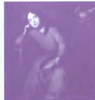
Virgen Niña meditando. Zurbarán