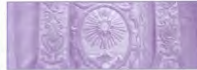
Bordados. Casulla sacramental