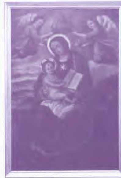
Virgen de Guía

PLAZA DE LA ENCARNACIÓN S/N - 11403 - JEREZ DE LA FRONTERA TEL. 956 16 90 59