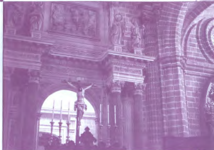
Altar Mayor de Jácome Baccaro - Cristo de José de Arce

En el interior destaca la portada de ingreso a la sacristía, realizada en piedra y jaspe. El templo es de planta cuadrangular, dividido en cinco naves por gruesas pilastras, más una sexta nave que es el llamado transepto. En la intersección de la nave mayor y del transepto se alza la airosa cúpula octogonal o