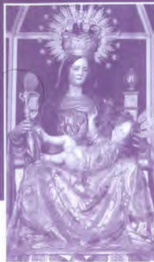
Ntra. Sra. de Belén